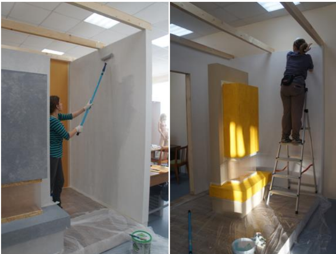
Рис 3. Модуль 3.Создание элемента оборудования.