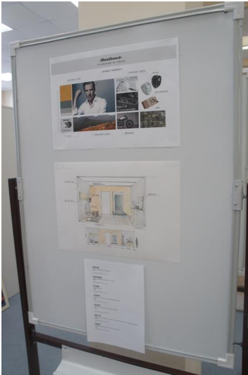
Рис 2. Модуль 2. Декорирование стен.